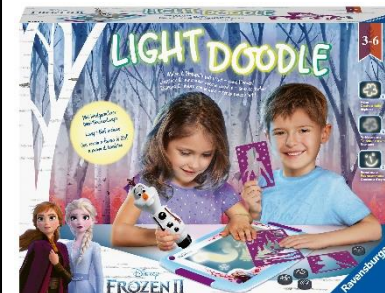
Light Doodle Disney Frozen für 34,99 Euro (UVP)

Bilddaten und Presstext zum Herunterladen unter